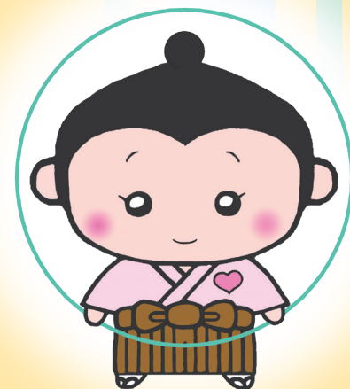
松江市権利擁護推進センター マスコットキャラクター まもるくん