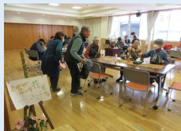
【なごやか寄り合い支援事業(島根地区社協)】

地区社会福祉協議会配分金として (寄付金の1/2相当を配分) 10,543,188円