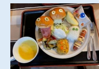
【kitchen-kitahori(キッチンきたほり)】