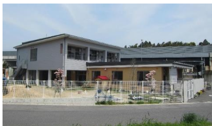
ひよし第2保育園 H24.4 開園