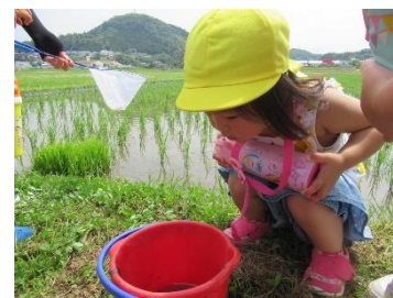
八雲の自然の中ですくすくと育ちます