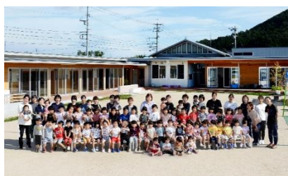
ひよし保育園 R3.4 新築移転