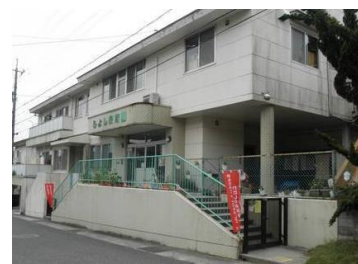
ひよしサンサンクラブ H18.4