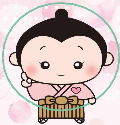
松江市権利擁護推進センター マスコットキャラクター まもるくん