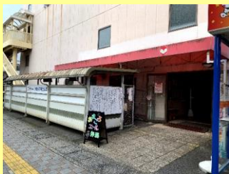
開催場所： 一畑百貨店立体駐車場 1 F 駐車場受付