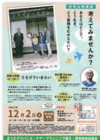
映画「うちげでいきたい」ポスター／チラシ