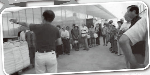
奥出雲へお出かけ。トマト農園で説明をききました。