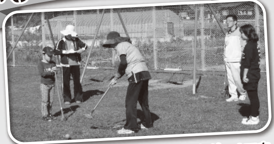
初めて会った地域の大人と子どもが、ペアを組んでゲームをして、アツという間に仲良くなりました。