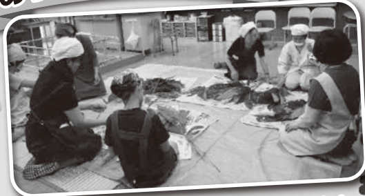
小学校で「ちまきづくり」を一緒にしました。子ども達と交流できて楽しかったです。