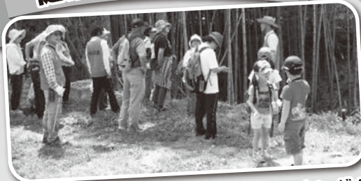
郷土の歴史を聞きながらのウォーキングも楽しいです。(牛切の泉にて)