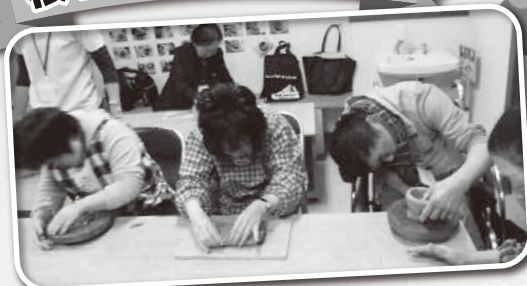
かんべの里で陶芸体験!みんな好きな形のものをつくりました。できあがりを楽しみ♪