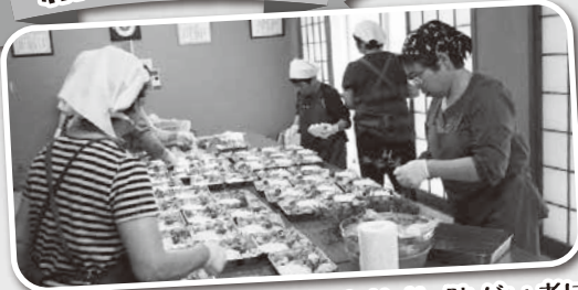
第三水曜日に一人暮らし高齢者・障がい者にお届けしています。