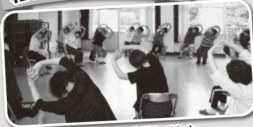
からだ元気塾を体験しました。