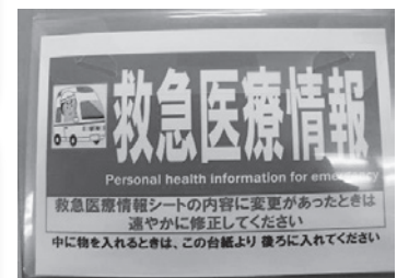
専用ケース (磁石で冷蔵庫に貼る)

※「申請書」「救急医療情報シート」は市のホームページからもダウンロードできます。