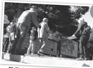
健康ウォーキング(美保関地区)