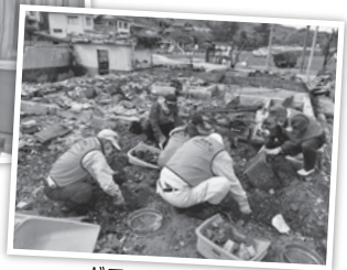
ボランティア活動「思い出の品探し」のようす