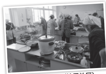
配食サービス(持田地区)