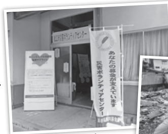
松江市災害ボランティアセンター